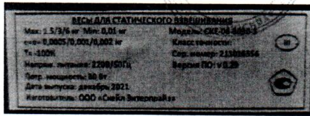
Рисунок 2 – Пример маркировочной таблички

Пример маркировочной таблички представлен на рисунке 2.