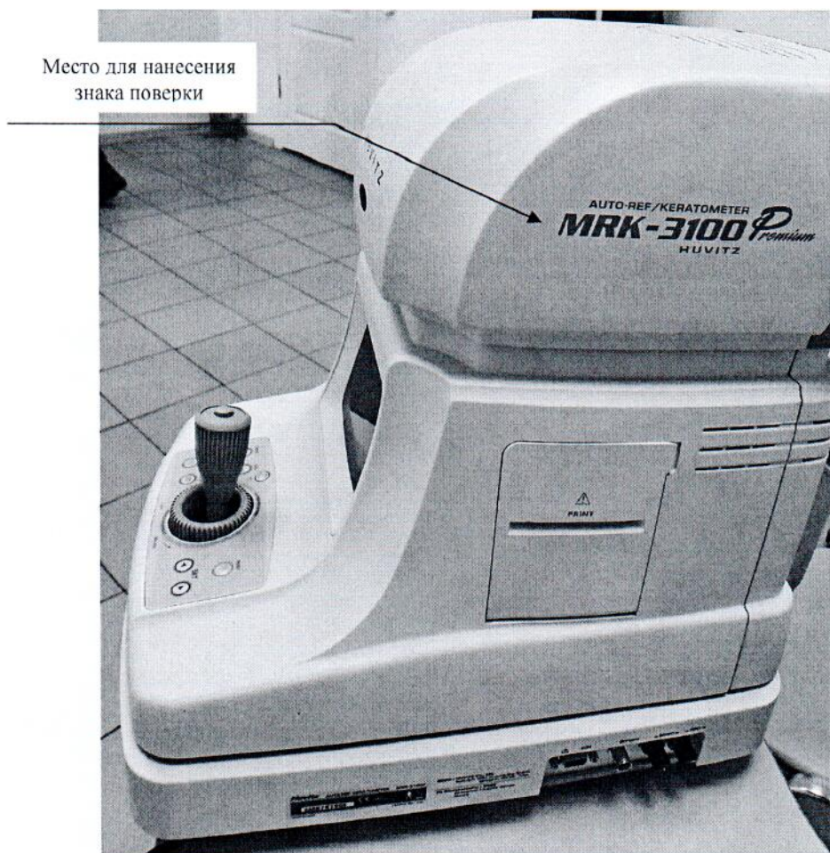
Рисунок 2.1—Схема (рисунок) с указанием места для нанесения знака поверки

Схема (рисунок) с указанием места для нанесения знака поверки средств измерений