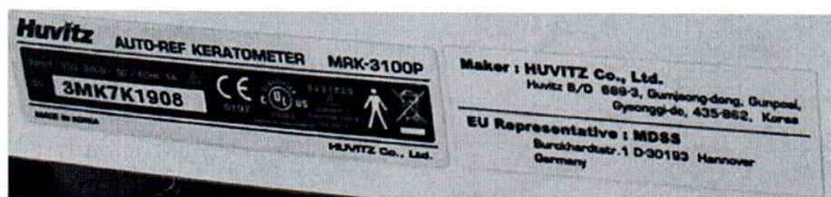
Рисунок 1.2 – Фотография маркировки авторефрактокератометра MRK-3100P № 3МК7К1908