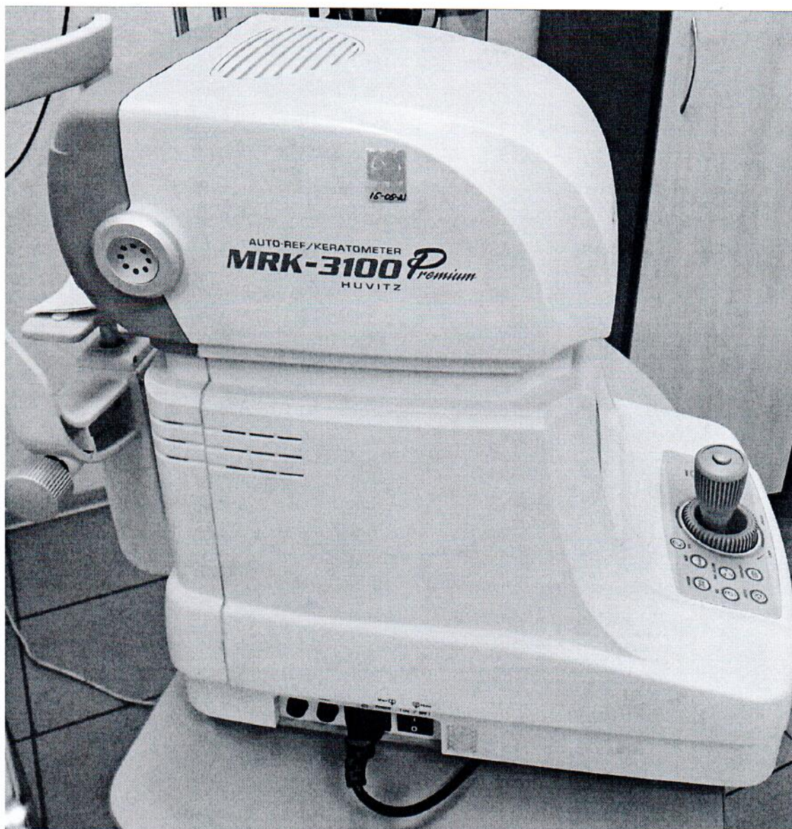
Рисунок 1.1 – Фотография общего вида авторефрактокератометра MRK-3100P № 3МК7К1908