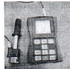
Рисунок 2. - Внешний вид модификации ТКМ-359С