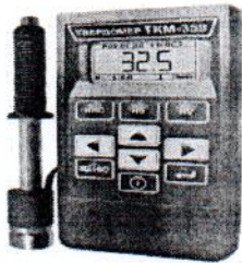
Рисунок 1.- Внешний вид модификации ТКМ-359М

Модификация ТКМ-359С оснащается цветным дисплеем, содержит расширенный набор сервисных функций программного обеспечения. Модификация ТКМ-359М оснащается чёрно-белым дисплеем, содержит сокращённый набор сервисных функций ПО. Метрологические характеристики у модификаций твердомера одинаковые.