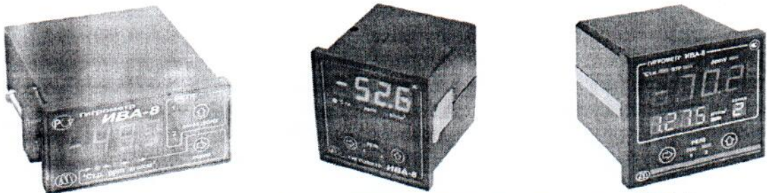
Рисунок 1 - Внешний вид блоков индикации гигрометра ИВА-8

Конструкция гигрометров ИВА-8 не имеет предусмотренных мест для установки пломб. Внешний вид вариантов блоков индикации приведен на рисунке 1. Блок индикации может быть оснащен одной, двумя или тремя секциями индикации. Внешний вид вариантов измерительных преобразователей ДТР-СМ приведен на рисунке 2. Измерительный преобразователь может быть оснащен разъемами различных конструкций.