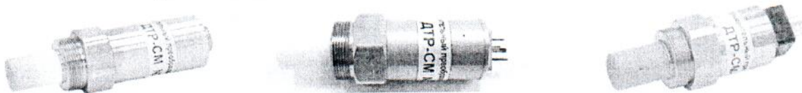
Рисунок 2 - Внешний вид измерительного преобразователя ДТР-СМ