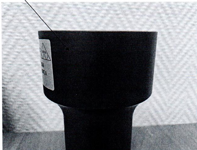
Рисунок 2.1 – Схема (рисунок) с указанием места для нанесения знака поверки на генератор FATS-B № K2022F0615