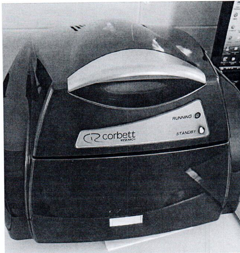
Рисунок 1.1 – Фотография общего вида амплификатора в режиме реального времени Corbett RG - 6000 № R080815

Фотография общего вида средств измерений