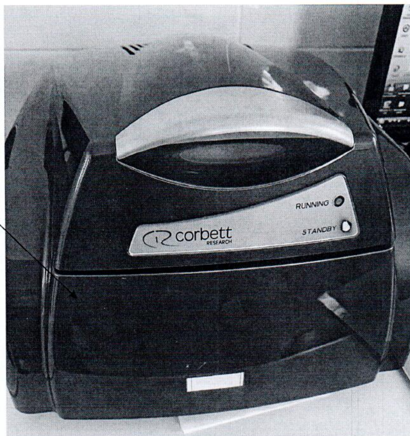
Рисунок 2.1 – Схема (рисунок) с указанием места для нанесения знака поверки