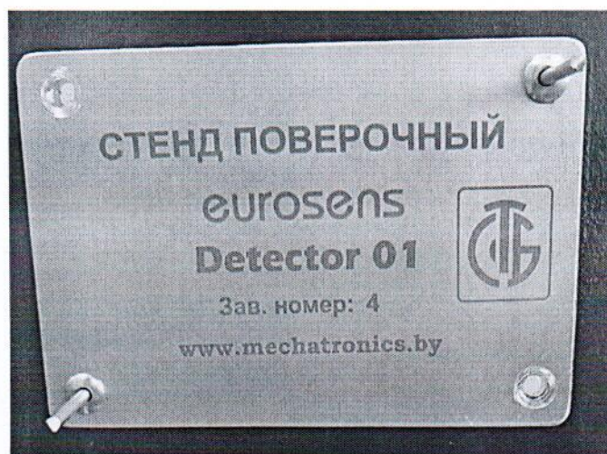
Рисунок 1.2 – Фотография маркировки стенда поверочного EUROSENS Detector 01 № 4