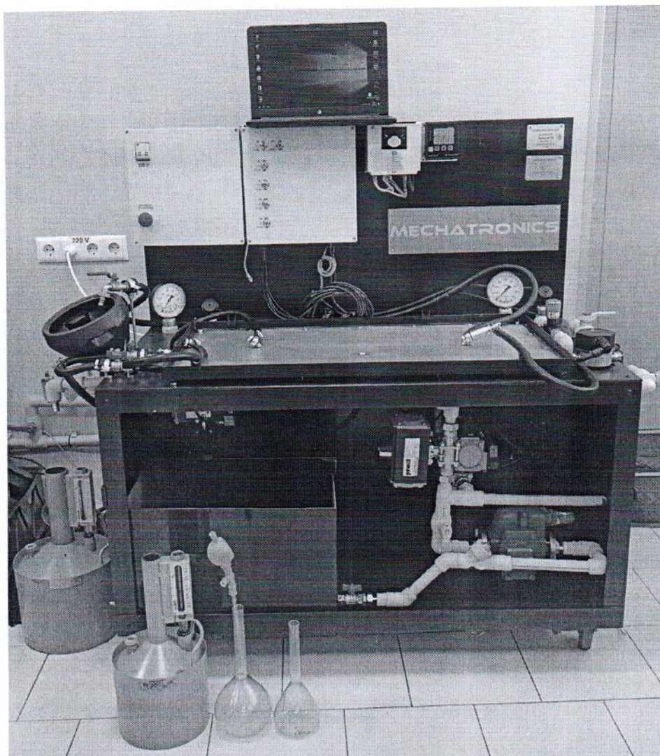
Рисунок 1.1 – Фотография общего вида стенда поверочного EUROSENS Detector 01 № 4