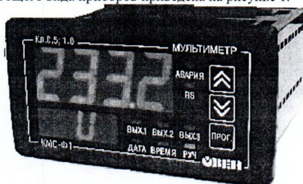
Рисунок 1. Общий вид приборов

Фотография общего вида приборов приведена на рисунке 1.