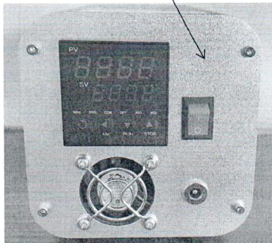
Рисунок 2.1 – Схема (рисунок) с указанием места для нанесения знака поверки средств измерений