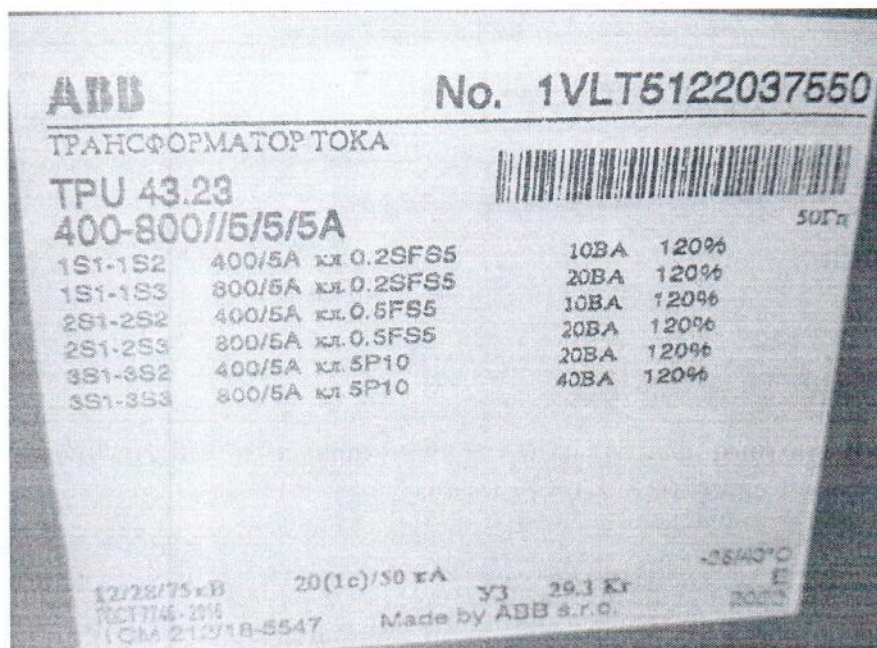
Рисунок 1.2 – Фотография маркировки трансформатора тока TPU 43.23 № 1VLT5122037550