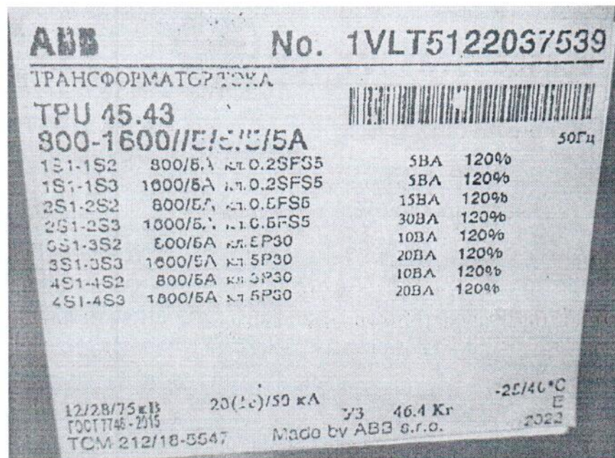
Рисунок 1.2 – Фотография маркировки трансформатора тока TPU 45.43 № 1VLT5122037539