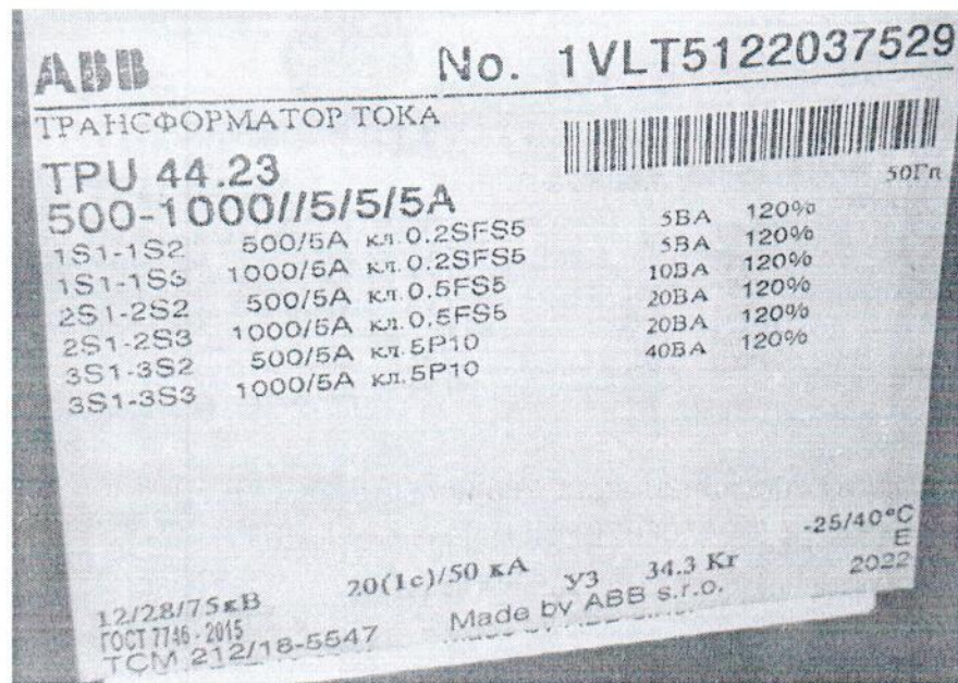
Рисунок 1.2 – Фотография маркировки трансформатора тока TPU 44.23 № 1VLT5122037529