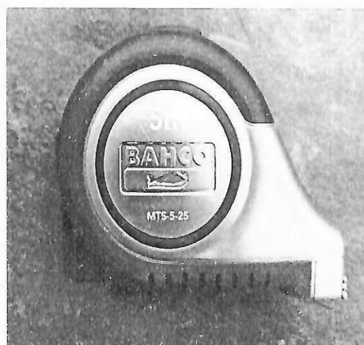
Рисунок 1.2 Фотография общего вида рулетки металлической измерительной МТС-5-25 (изображение носит иллюстративный характер)