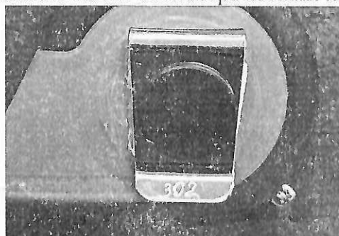
Рисунок 1.3 – Фотография маркировки рулетки металлической измерительной (изображение носит иллюстративный характер)