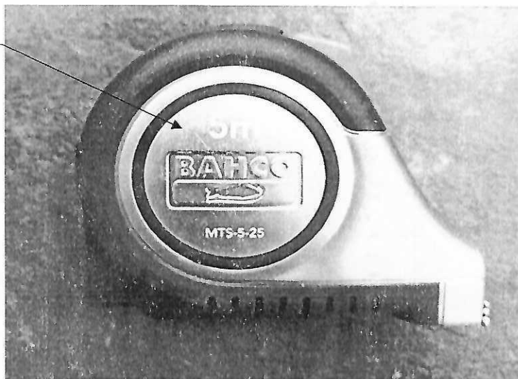
Рисунок 2 – Схема (рисунок) с указанием места для нанесения знака поверки средств измерений