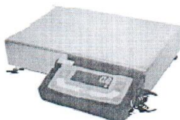
Рисунок 2 - Общий вид весов семейства 2

Для защиты весов от несанкционированной настройки и вмешательства, которые могут привести к искажению результатов измерений, весы пломбуются поверх винтов стяжки корпуса защитной наклейкой изготовителя (рисунок 3, обозначение наклейки «3»). При отклеивании разрушается изображение, нанесенное на наклейку. Отсутствие самой наклейки или разрушенное изображение надписей на наклейке свидетельствует об имевших место несанкционированных действиях.