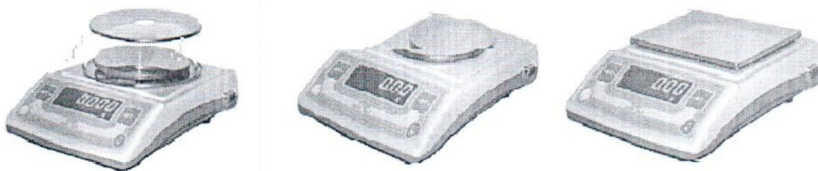
Рисунок 1 - Общий вид весов семейства 1

Весы оснащены интерфейсом, совместимым с RS232.