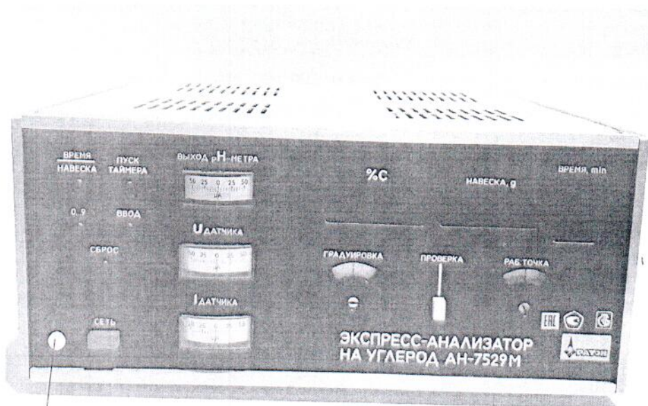
Схема (рисунок) с указанием места для нанесения знака поверки средств измерений

Место нанесения знака поверки при нанесении методом наклеивания