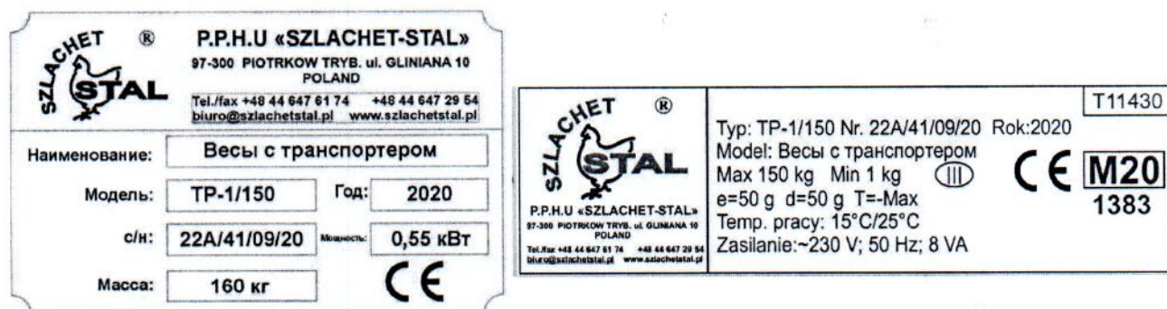
Рисунок 1.2 – Фотография маркировки весов с транспортером TP-1/150 № 22А/41/09/20