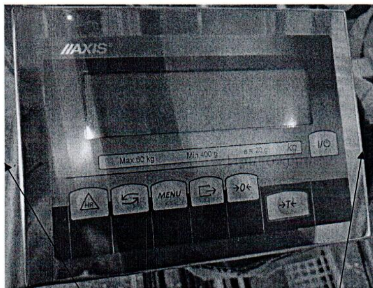
Схема (рисунок) с указанием места для нанесения знака поверки средств измерений