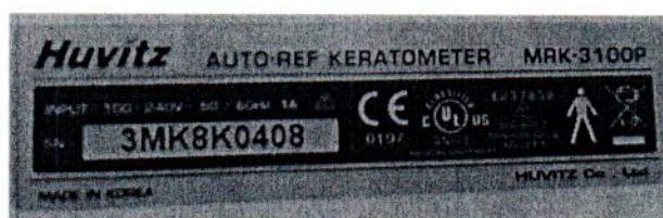
Рисунок 1.2 – Фотография маркировки авторефрактометра MRK-3100P № 3МК8К0408