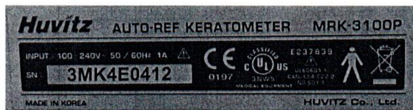
Рисунок 1.2 – Фотография маркировки авторефрактометра MRK-3100P № 3МК4Е0412