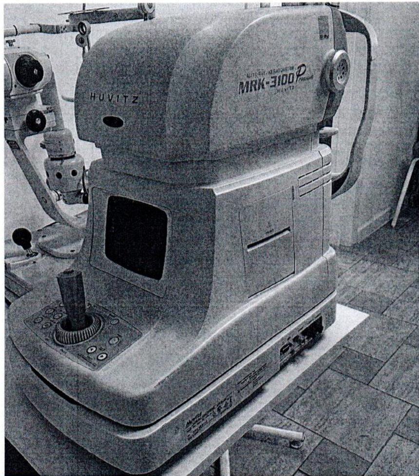
Рисунок 1.1– Фотография общего вида авторефрактометра MRK-3100P № 3МК4Е0412