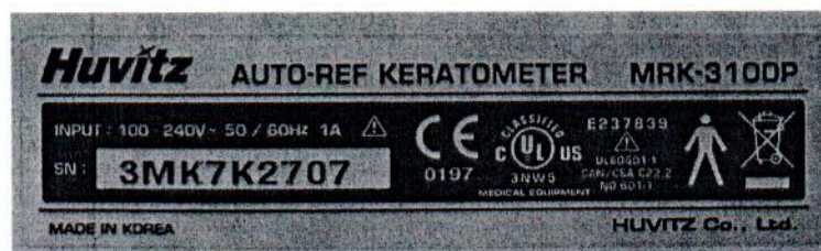
Рисунок 1.2 – Фотография маркировки авторефрактокератометра MRK-3100P № 3МК7К2707