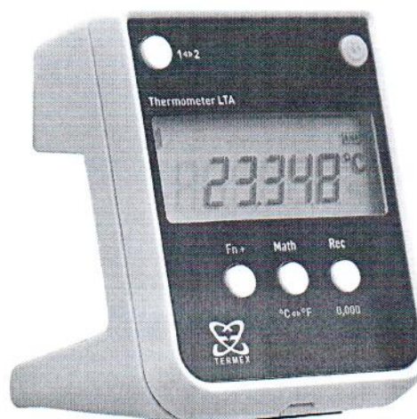
Рисунок 3 - внешний вид электронного блока термометра с секундомером

Пломбирование термометров осуществляется путем наклеивания на тыльную сторону электронного блока пломбировочной наклейки с маркировкой.