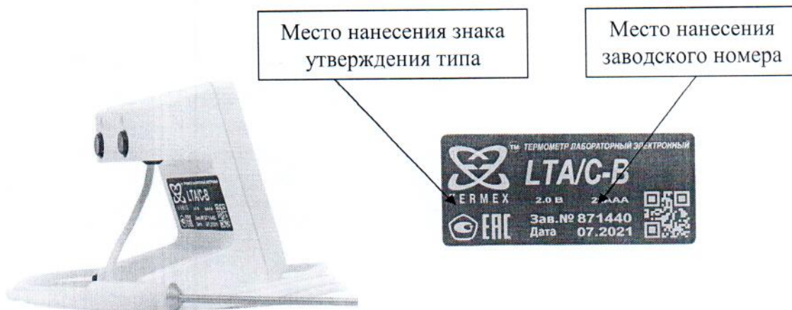
Рисунок 2 – внешний вид термометра с неразъемным соединением датчика к электронному блоку и его пломбировочная наклейка с указанием мест нанесения знака утверждения типа и заводского номера