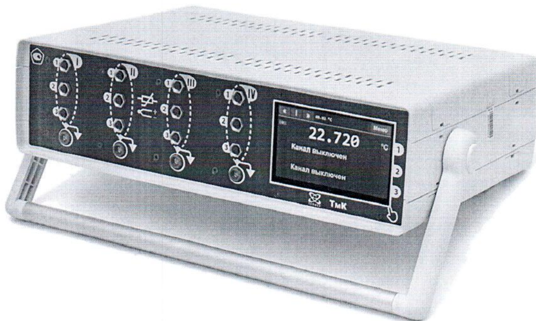
Рисунок 3 — Внешний вид термометра ТмК-04 (с четырьмя измерительными модулями)