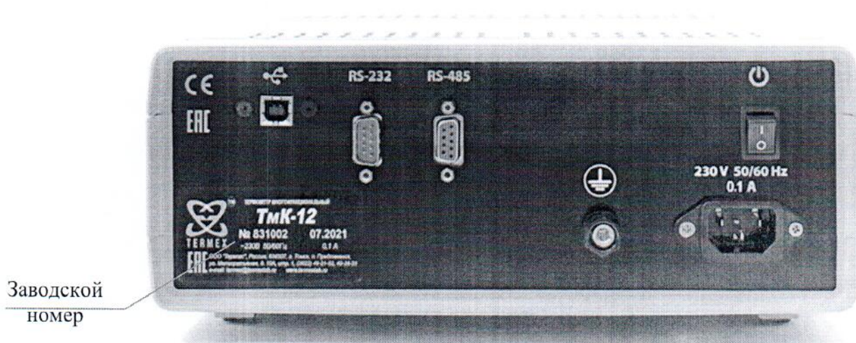
Рисунок 4 — Внешний вид термометров сзади, с указанием места расположения заводского номера

Пломбирование термометров не предусмотрено.