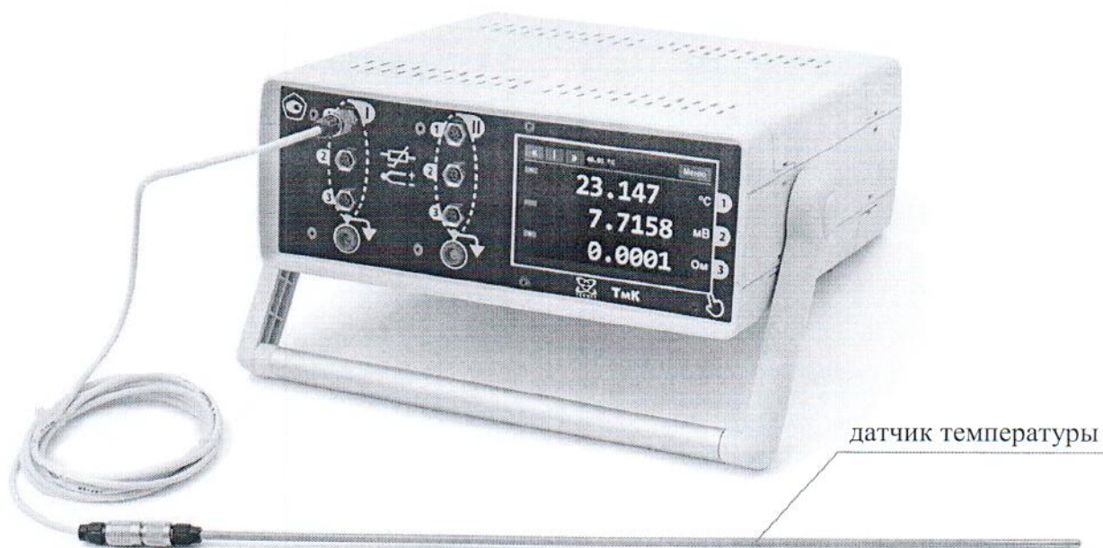
Рисунок 2 — Внешний вид термометра ТМК-12 (с двумя измерительными модулями и датчиком температуры)