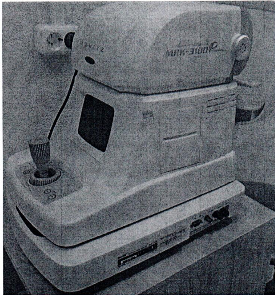
Рисунок 1.1 – Фотография общего вида авторефрактометра MRK-3100P № 3МК8Е2003