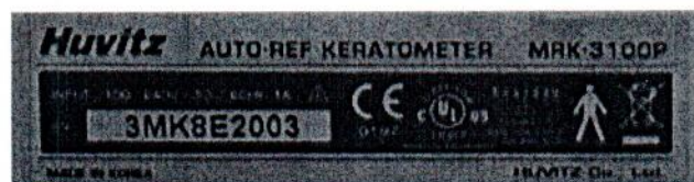
Рисунок 1.2 – Фотография маркировки авторефрактометра MRK-3100P № 3МК8Е2003