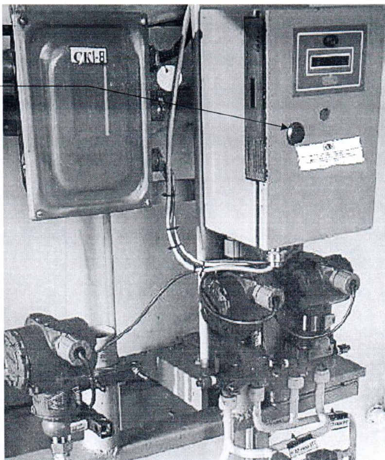
Рисунок 3.1 – Схема пломбировки от несанкционированного доступа

Место пломбировки от несанкционированного доступа