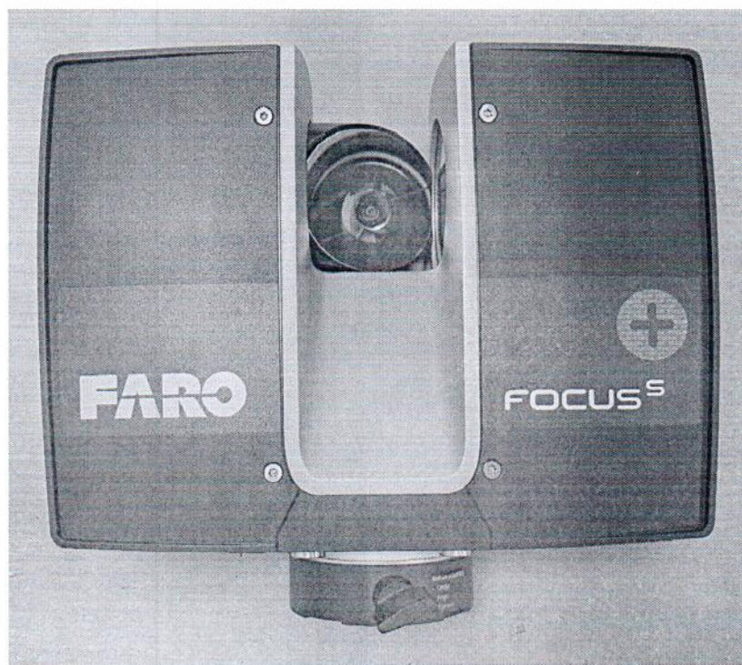
Рисунок 1.1 – Фотография общего вида лазерного сканера FARO Focus S Plus 150 № LLS082119726