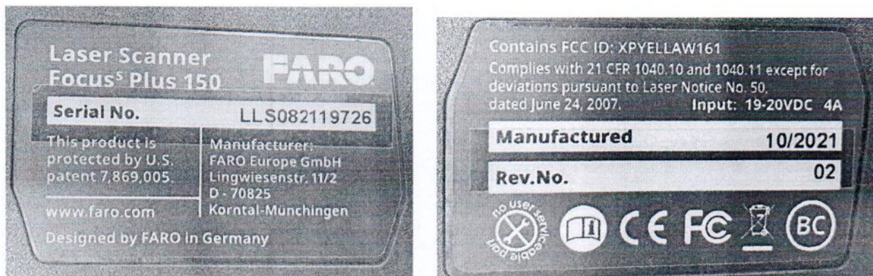
Рисунок 1.2 – Фотография маркировки лазерного сканера FARO Focus S Plus 150 № LLS082119726