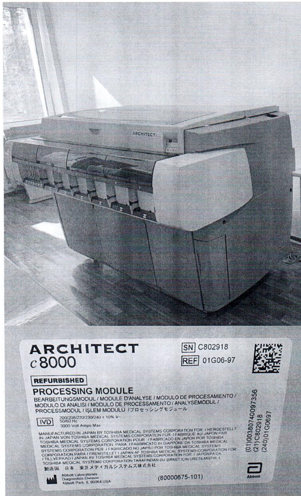
Рисунок 1.1 – Фотография общего вида анализатора биохимического автоматического: анализатор биохимический модульный ARCHITECT с принадлежностями: модель c8000 с принадлежностями № С802918