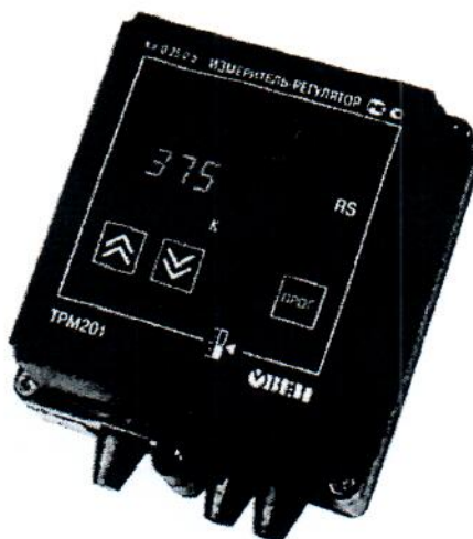
Рис.2 - Общий вид приборов в корпусе Н – для настенного крепления