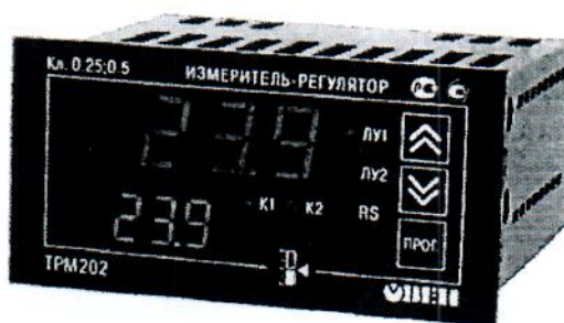
Рис.3 - Общий вид приборов в корпусе Щ2 – для щитового крепления