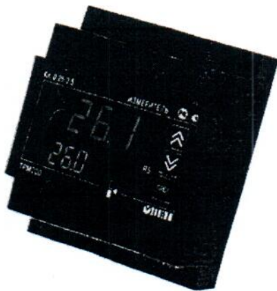
Рис.1 - Общий вид приборов в корпусе Д – для крепления на DIN-рейку

Фотографии общего вида приборов приведены на рисунках 1-4.