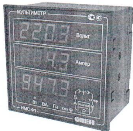
Общий вид приборов в корпусе Щ1 Рисунок 1

Фотографии общего вида приборов приведены на рисунках 1 и 2.