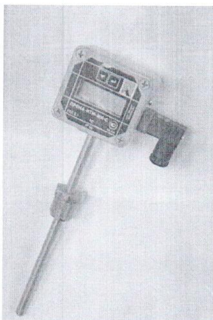
Фото 4. Фотография общего вида измерителя ПРОМА-ИТМ-МИ-С.