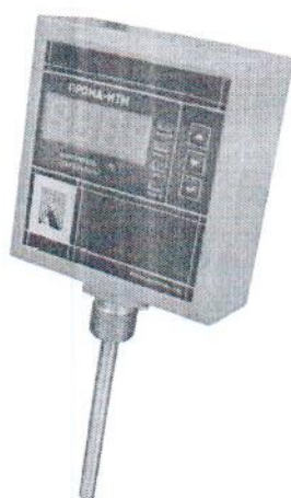
Фото 3. Фотография общего вида измерителя для установки на трубовод ПРОМА-ИТМ-Р.