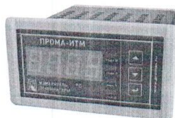
Фото 1. Фотография общего вида измерителя щитового исполнения ПРОМА-ИТМ-Щ.

Фотографии общего вида измерителей приведены на фото 1,2,3,4.