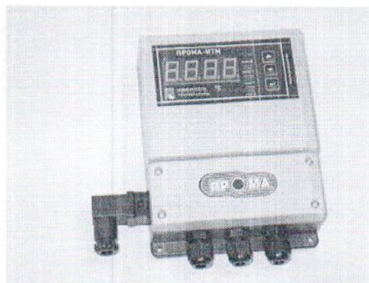
Фото 2. Фотография общего вида измерителя настенного исполнения ПРОМА-ИТМ-Н.