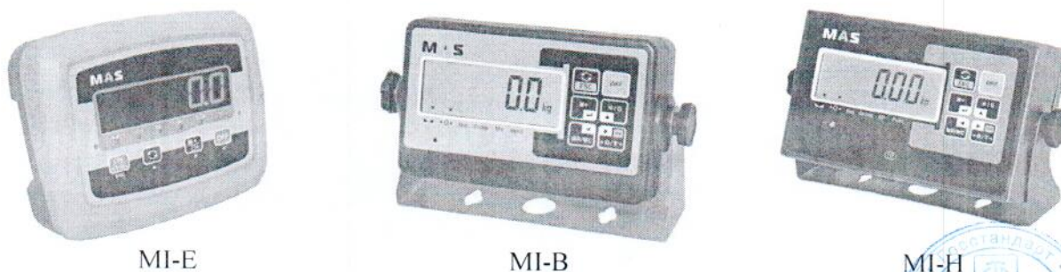
Рисунок 2 - Общий вид индикаторов