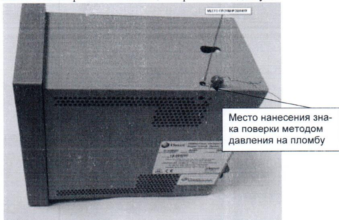
Рисунок 3.1 – Место пломбировки на боковой поверхности

Схема пломбировки от несанкционированного доступа