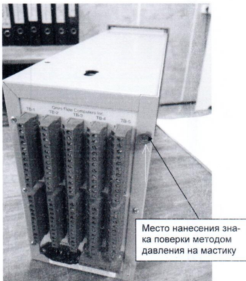
Рисунок 3.2 – Место пломбировки на задней поверхности