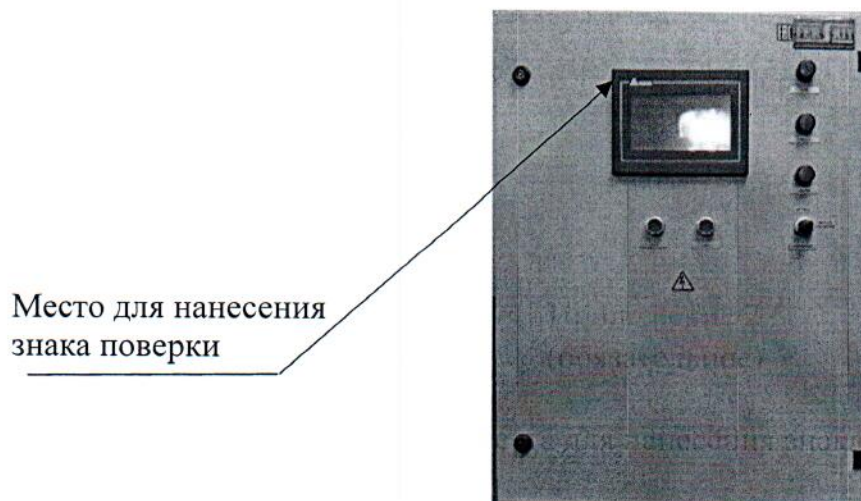
Рисунок 2.1 – Схема (рисунок) с указанием места для нанесения знака поверки средств измерений

Схема (рисунок) с указанием места для нанесения знака поверки средств измерений