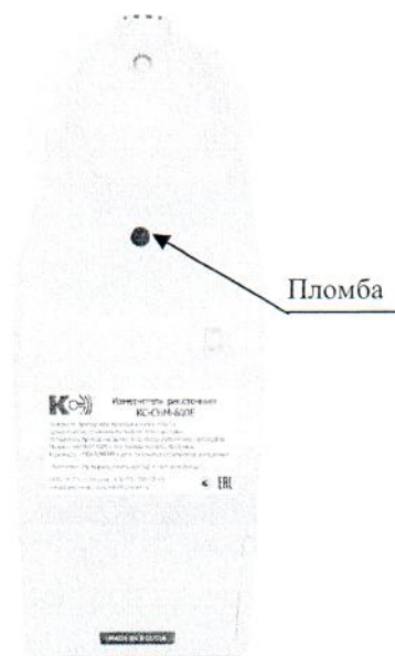
Рисунок 4 - Схема пломбировки от несанкционированного доступа измерителей КС-СНМ-600Е