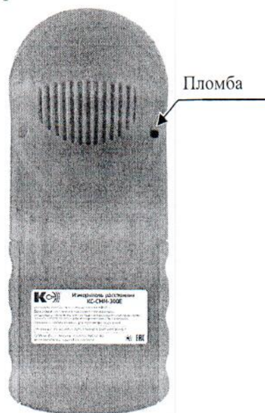
Рисунок 3 - Схема пломбировки от несанкционированного доступа измерителей КС-СНМ-600А

Опломбирование в целях защиты от несанкционированного вмешательства и настройки производится посредством установки заглушки на один из крепежных винтов на тыльной стороне измерителя.