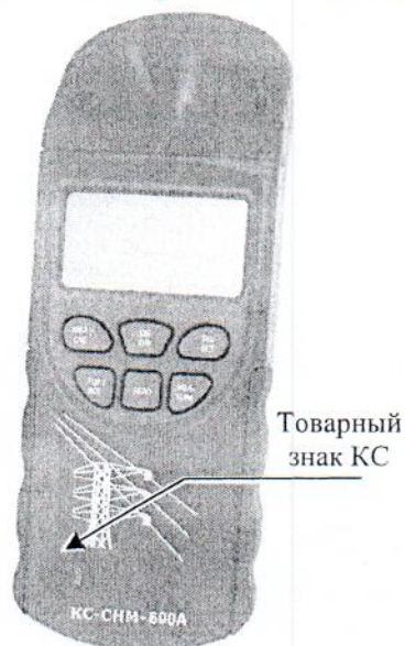
Рисунок 1 - Общий вид измерителя КС-СНМ-600А с указанием места расположения товарного знака КС

Схема пломбировки от несанкционированного доступа представлена на рисунках 3 и 4.