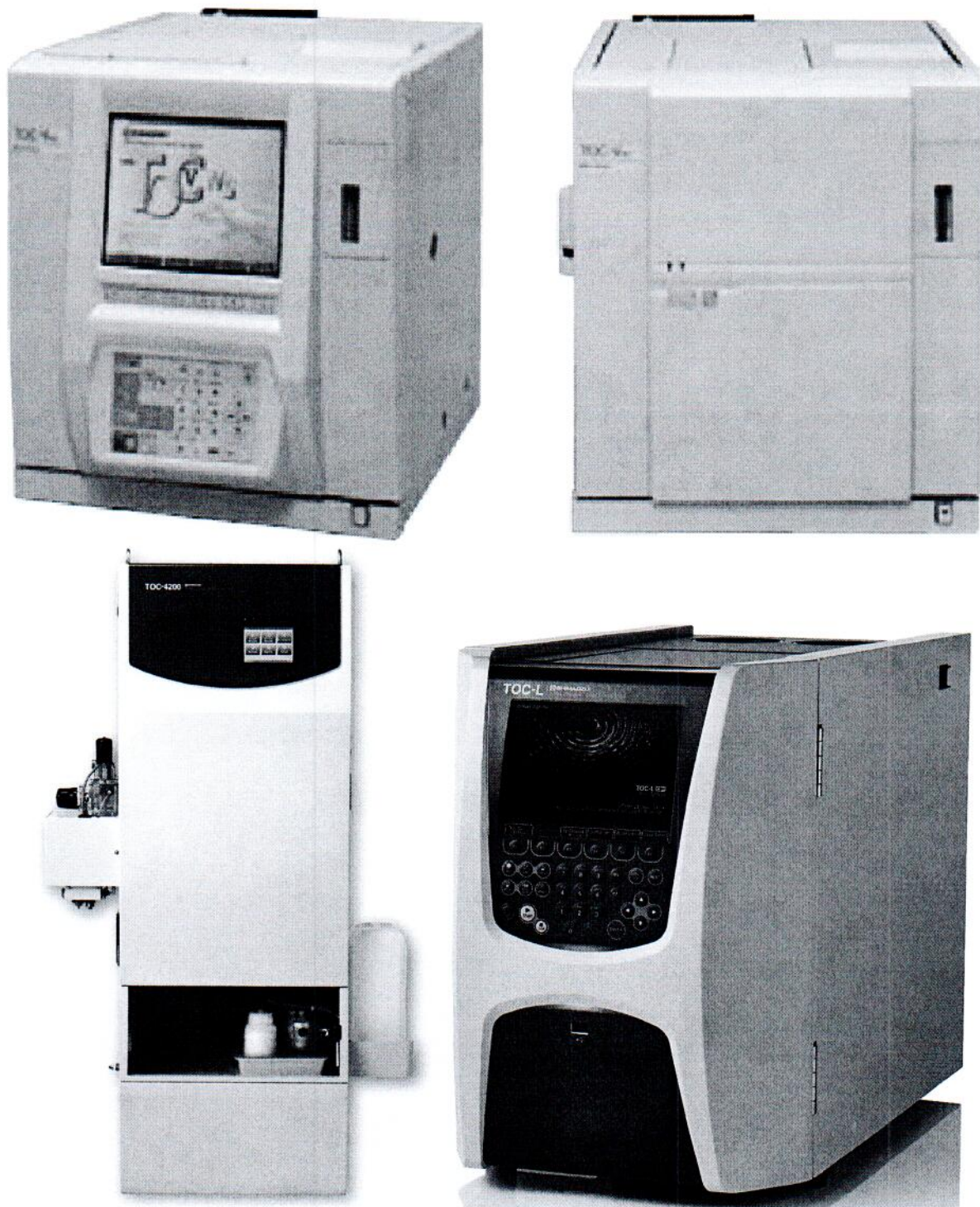
Рисунок 1. Внешний вид анализаторов