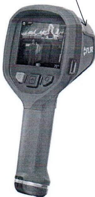
Рисунок 2.1 – Схема (рисунок) с указанием места для нанесения знака поверки средств измерений (изображение носит иллюстративный характер)