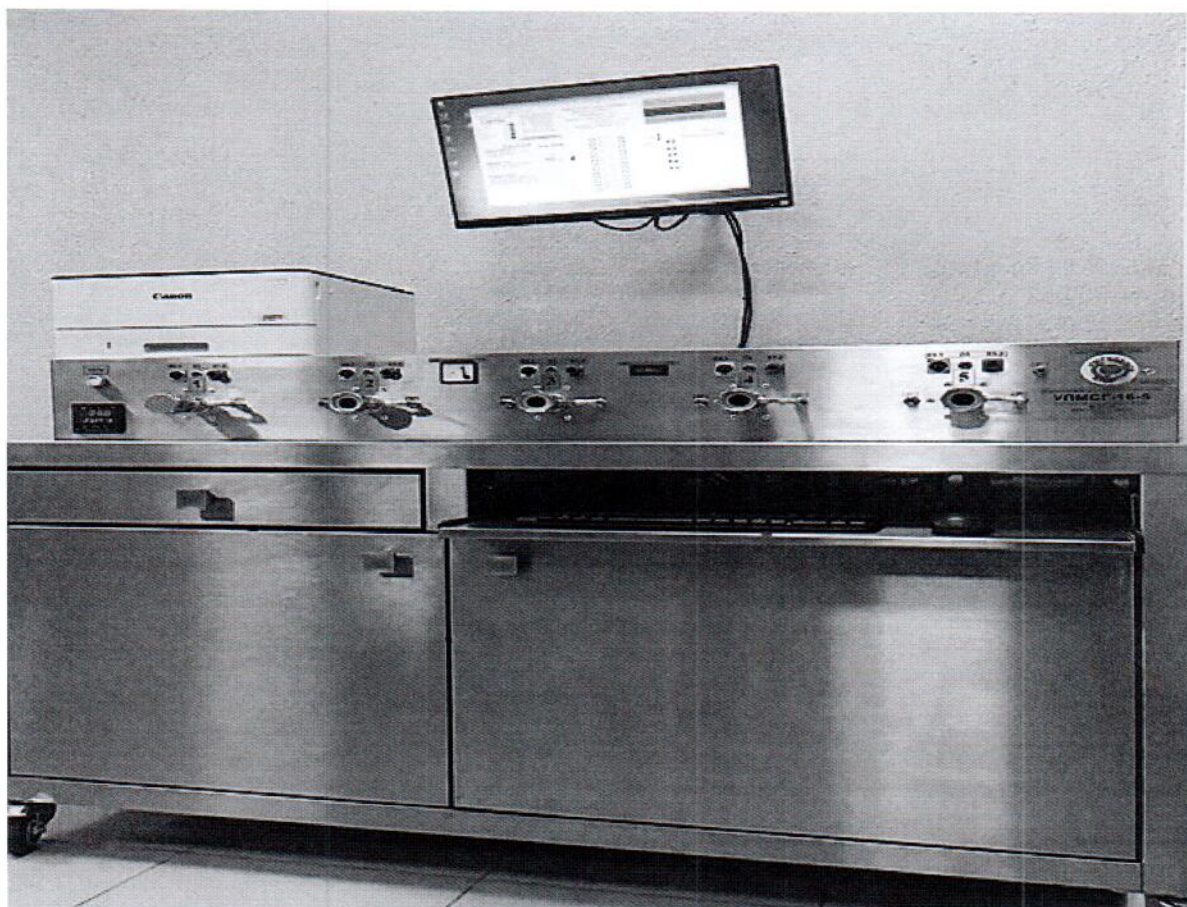
Рисунок 1.1 – Фотография общего вида установки поверки малогабаритных счетчиков газа УПМСГ-16-5 № 21-02