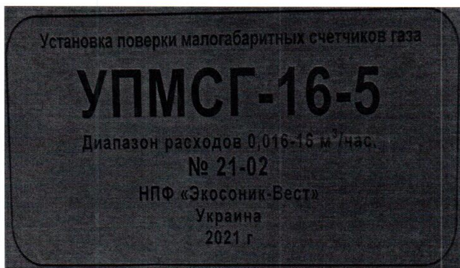
Рисунок 1.2 – Фотография маркировки установки поверки малогабаритных счетчиков газа УПМСГ-16-5 № 21-02