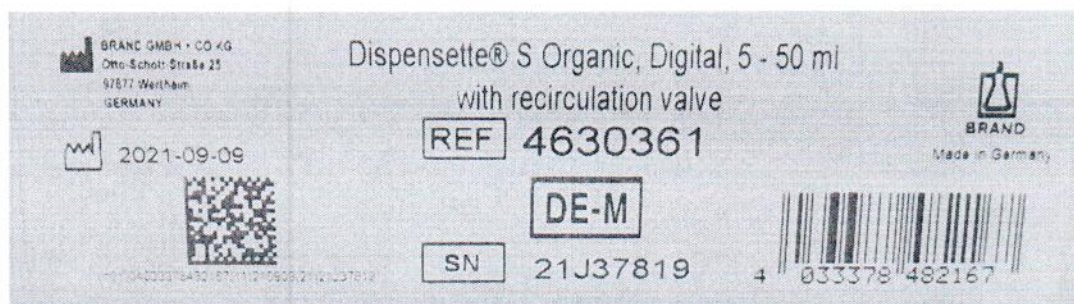
Рисунок 1.2 – Фотография маркировки дозатора бутылочного Dispensette S Organic № 21J37819