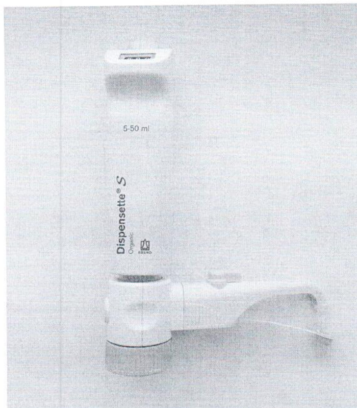
Рисунок 1.1 – Фотография общего вида дозатора бутылочного Dispensette S Organic № 21J37818