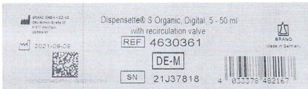
Рисунок 1.2 – Фотография маркировки дозатора бутылочного Dispensette S Organic № 21J37818