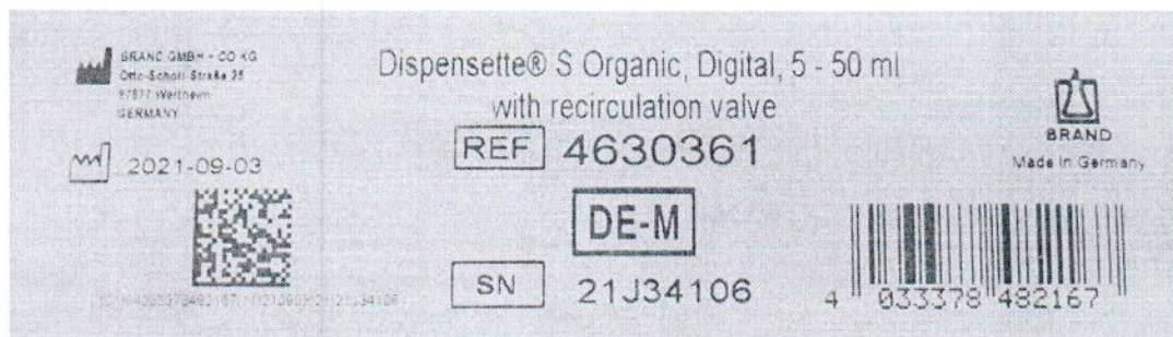
Рисунок 1.2 – Фотография маркировки дозатора бутылочного Dispensette S Organic № 21J34106