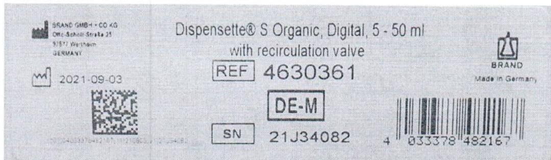
Рисунок 1.2 – Фотография маркировки дозатора бутылочного Dispensette S Organic № 21J34082