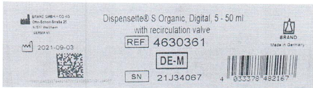
Рисунок 1.2 – Фотография маркировки дозатора бутылочного Dispensette S Organic № 21J34067