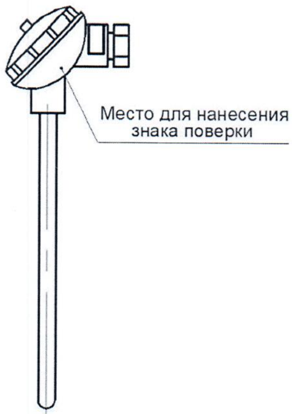
Рисунок 2.1 – Схема (рисунок) с указанием места для нанесения знака поверки средств измерений на ТС с клеммной головкой

Схема (рисунок) с указанием места для нанесения знака поверки средств измерений