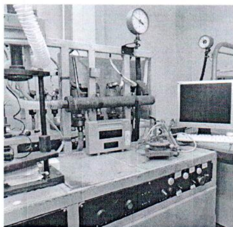
Рисунок 1.2 – Внешний вид пульта управления стенда