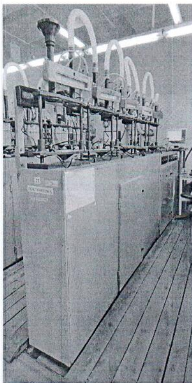
Рисунок 1.1 – Общий вид стенда

Фотографии общего вида и маркировки средства измерений