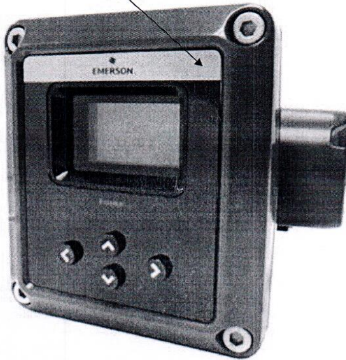
Рисунок 2.1 – Место для нанесения знака поверки в виде клейма-наклейки