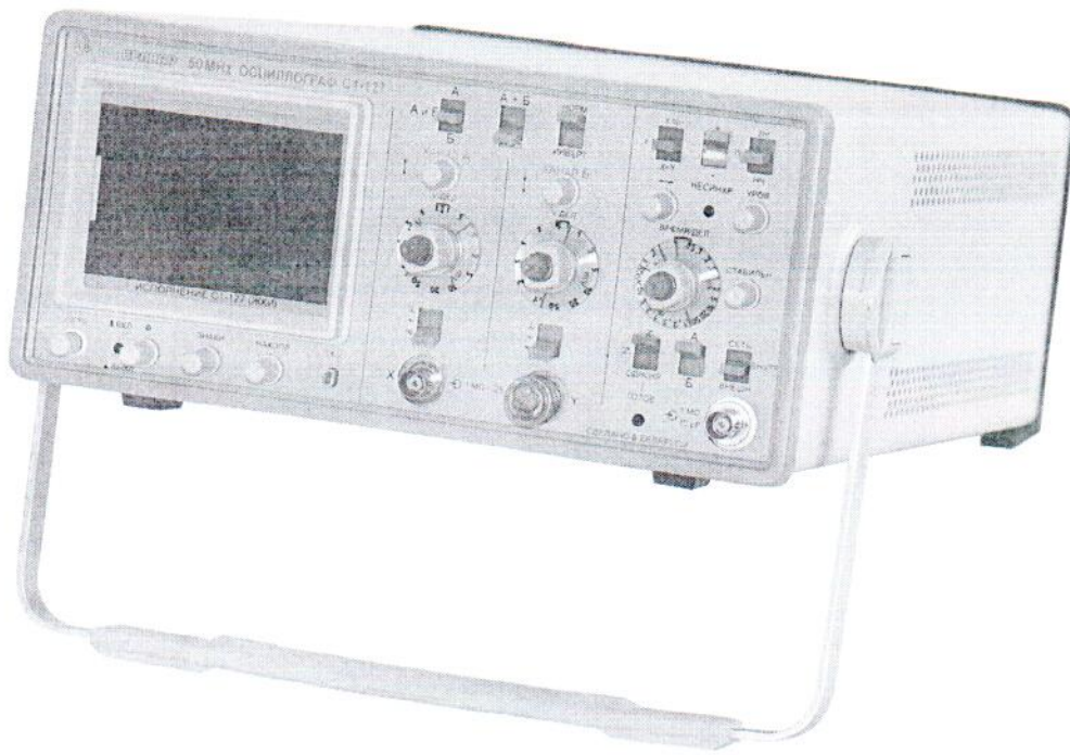
Рисунок 1.1 – Фотография общего вида осциллографа С1-127 (ЖКИ) (изображение носит иллюстративный характер)