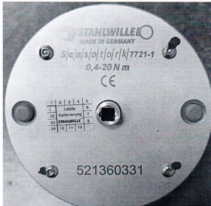
Рисунок 1.1 – Фотография общего вида датчика крутящего момента 7721-1 № 521360331

Фотография общего вида средств измерений