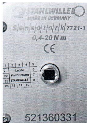
Рисунок 1.2 – Фотография маркировки датчика крутящего момента 7721-1 № 521360331