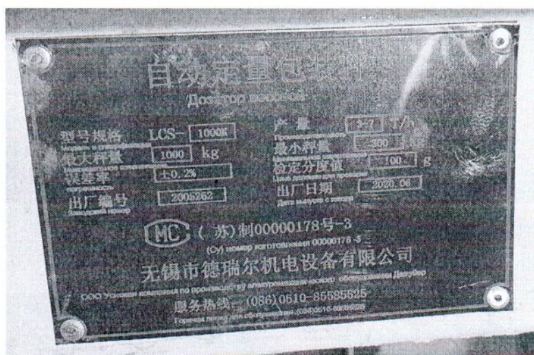
Рисунок 1.2 – Маркировка дозатора весового автоматического LCS-1000K № 2005262