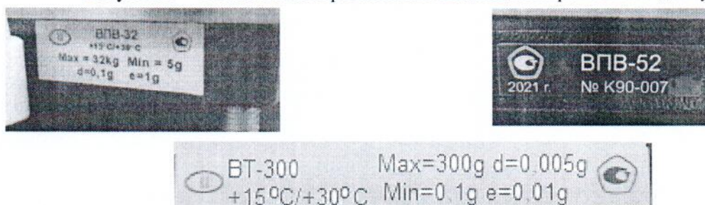
Рисунок 3 – Пример маркировки весов