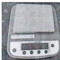
Весы серии ВТ