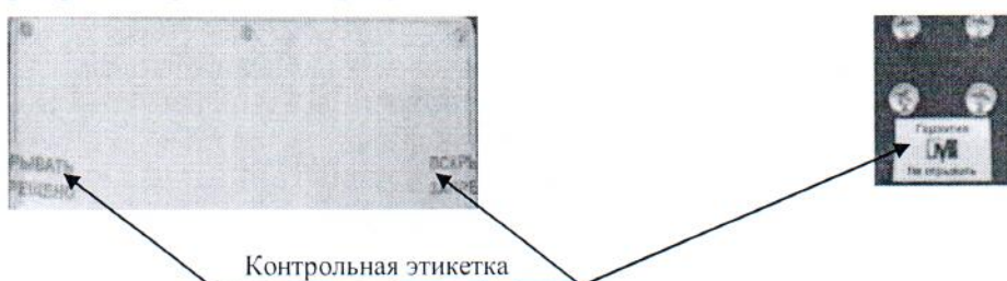
Рисунок 2 - Схема пломбирования от несанкционированного доступа

Серийный номер и буквенно-цифровое обозначение модификации приведено на маркировочной табличке в виде наклейки, расположенной на задней стенке основания весов. Пример маркировки приведен на рисунке 3.