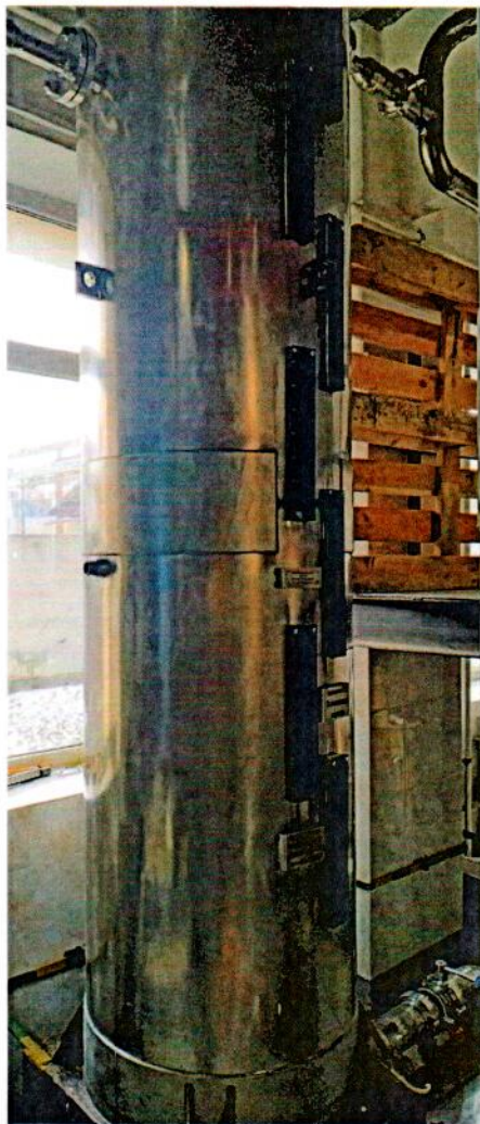
Рисунок 1 – Общий вид мерника технического 1-го класса М1кл-750 № 12