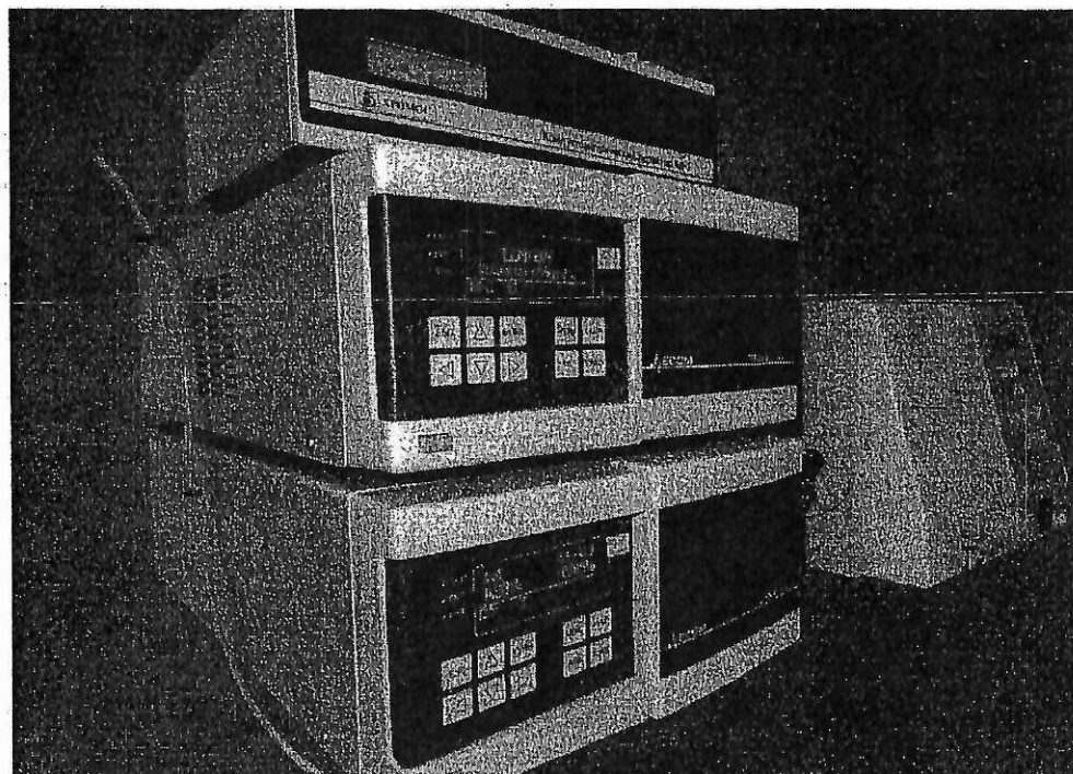
Рисунок 1 - Общий вид хроматографа жидкостного «Хромос ЖХ-301»

Фотографии аналитического блока и места нанесения знака поверки.