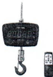
Рисунок 2 ВЭК/2-1000