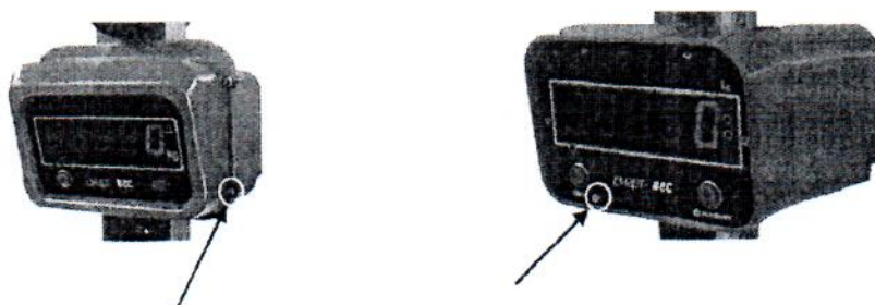
Рисунок 6 - Схема пломбировки модификаций весов ВЭК/3, ВЭК/4

Для защиты от механической модификации корпус весов пломбируется свинцовой, либо мастичной пломбой на крепежном элементе корпуса или пульта.