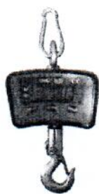
Рисунок 1 ВЭК/1-150, ВЭК/1- 200, ВЭК/1- 300, ВЭК/1-500

Общий вид весов крановых ВЭК представлен на рисунках 1- 5.