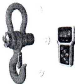
Рисунок 5 - ВЭЖ/5

Для защиты от несанкционированного доступа в режим юстировки в модификациях ВЭК/3, ВЭК/4 пломбируется корпус весов для ограничения доступа к переключателю в режим юстировки (рис. 6), в модификациях ВЭК/1, ВЭК/2, ВЭК/5 используется пароль. ПО не может быть модифицировано без нарушения защитной пломбы и изменения положения переключателя юстировки.